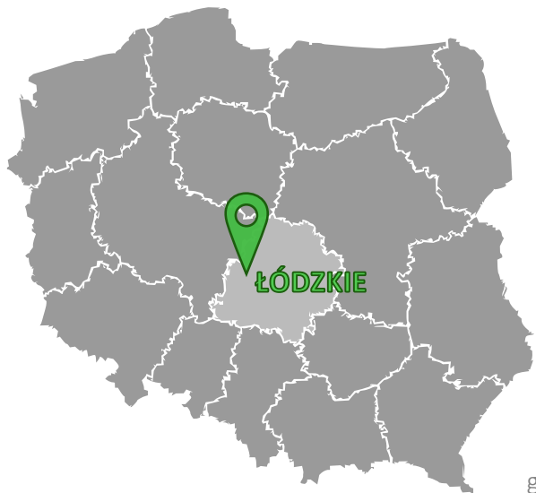
LOKALIZACJA W SKALI KRAJU