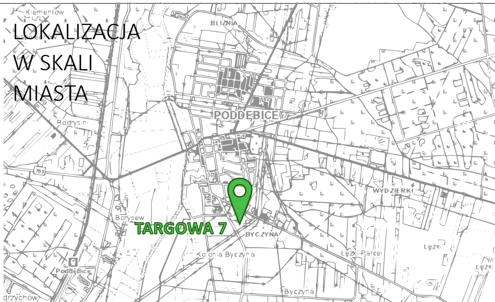
LOKALIZACJA W SKALI MIASTA

WIZUALIZACJE BUDYNKU M5 - PROPONOWANA KOLORYSTYKA I MATERIAŁOWANIE